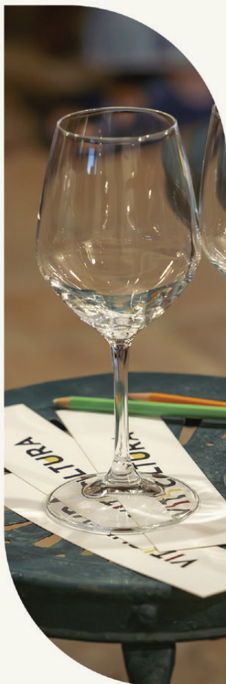
Tavola rotonda in compagnia dell'autore e un calice di vino dell'Azienda Agricola Barbuti Giuseppe, omaggio sinergico al dialogo e ai prodotti del territorio.