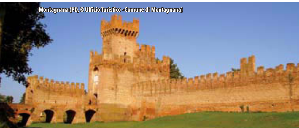
Montagnana (PD, © Ufficio Turistico - Comune di Montagnana)

Prov. Trento: Molveno (Paesi a Bandiera arancione, Comuni fioriti) ▶