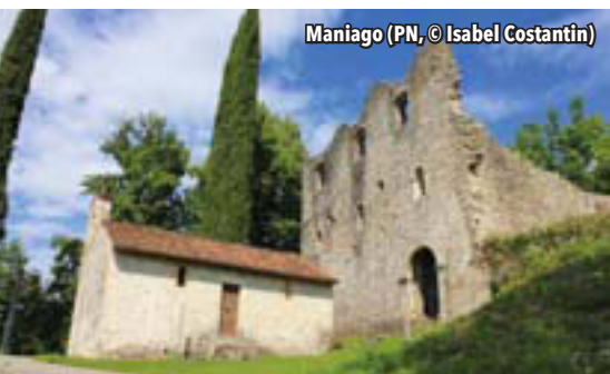
Maniago (PN)