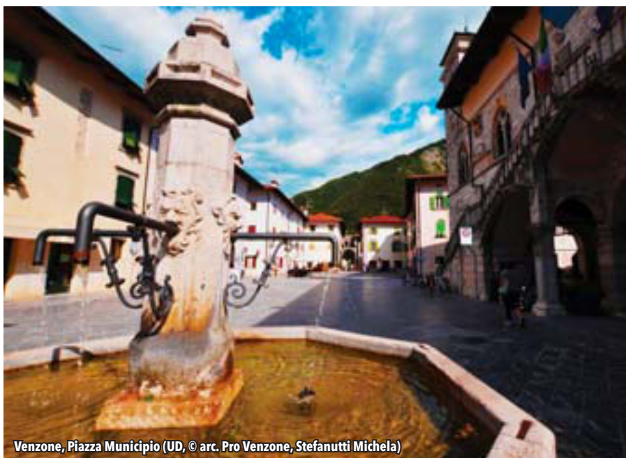
Venzone, Piazza Municipio (UD, © arc. Pro Venzone, Stefanutti Michela)