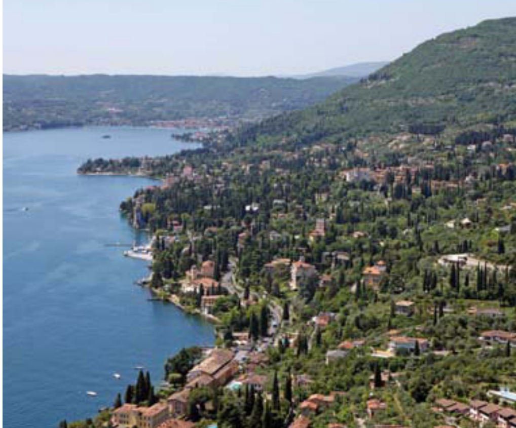
Gardone Riviera (BS)

dotati di strutture di accoglienza, leggendo questo articolo, si affrettino a recuperare il tempo perduto.