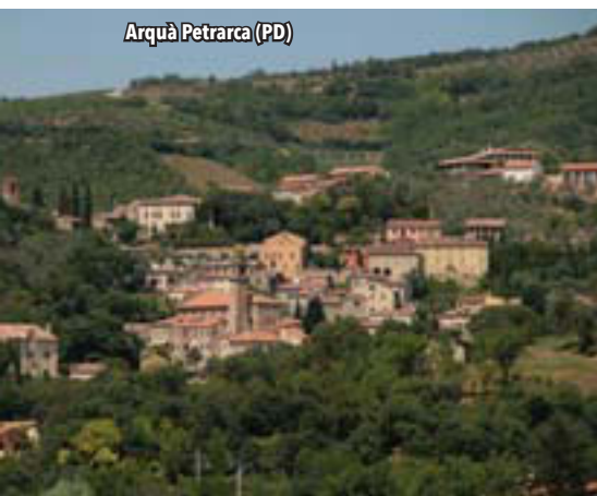
Arquà Petrarca (PD)