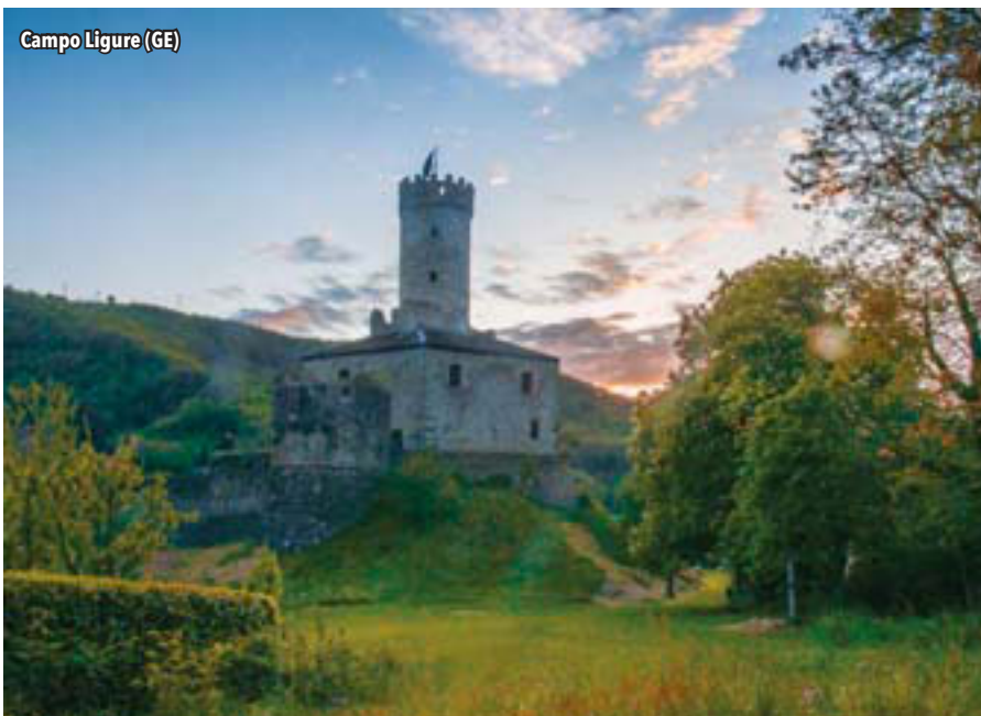
Campo Ligure (GE)

La vocazione turistica di questa regione è evidente: è infatti la più visitata d'Italia . Questa sua vocazione si esprime attraverso le città d'arte, le città murate, le ville palladiane, il mare, i numerosi laghi, ►