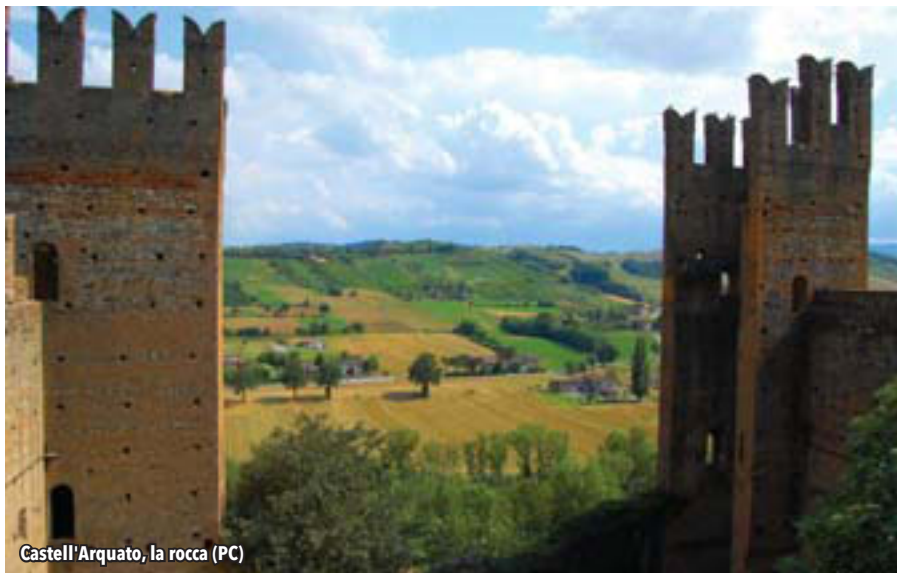
Castell'Arquato, la rocca (PC)

Questa si può definire la regione turistica per antonomasia . Le spiagge, le città d'arte, i borghi caratteristici, la gastronomia e la varietà di divertimenti a disposizione sono un richiamo irresistibile per centinaia di migliaia di turisti ogni anno. Anche il turismo itinerante trova nelle 311 strutture di accoglienza un'adeguata sistemazione. Tra queste ben 19 sono situate nei comuni di cui stia-